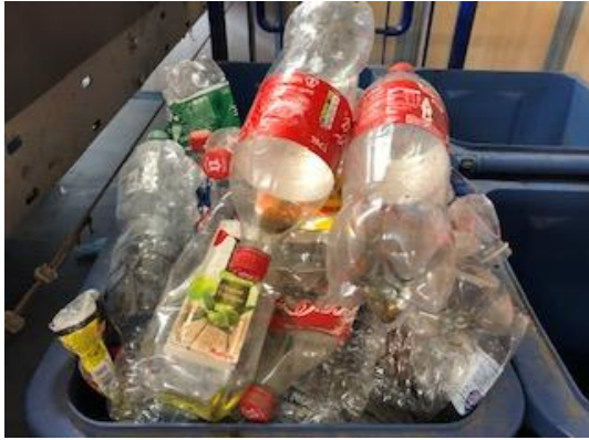
PET CLAIR PLASTIQUE