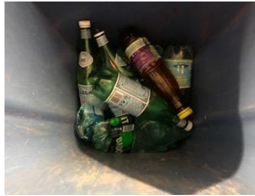
PET FONCE PLASTIQUE